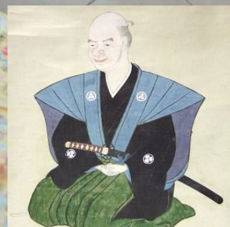
『長久保赤水像(自画自賛)』 (高槻市歴史民俗資料館蔵)